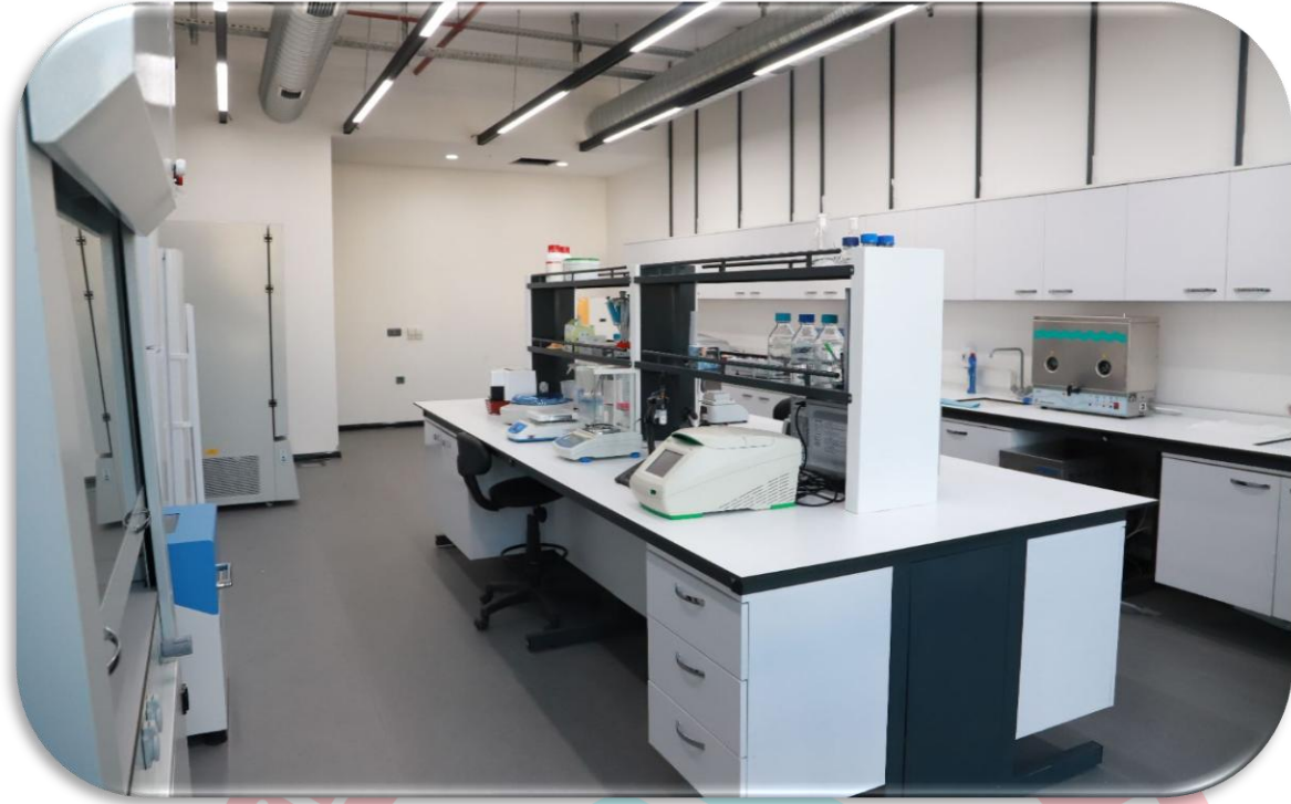
Şekil 4. Bitki Hastalıkları Laboratuvarı

4.1.1.5. Toprak Bilimi ve Bitki Besleme Laboratuvarı: Doğal kaynakların hızla tüketilmesi, arazi tahribatına bağlı olarak ekosistem hizmetlerindeki kayıplar, iklim değişikliği ve çölleşme etkisi ile sosyal ve ekonomik yönden tarım ve gıda güvenliği üzerindeki baskı giderek artmaktadır. Doğada heterojen yapıda bulunan toprakların; fiziksel, kimyasal, biyolojik ve morfolojik özelliklerinin belirlenerek, toprakların kendine has üretim ve kullanım isteklerinin göz önünde bulundurulduğu arazi kullanım planlamalarının oluşturulması, toprakların korunumu açısından büyük önem arz etmektedir. Sivas Bilim ve Teknoloji Üniversitesi, Tarım Bilimleri ve Teknoloji Fakültesi bünyesinde Toprak Bilimine yönelik yürütmüş olduğumuz çalışmalarda; toprakların kendine özgü karakteristiklerini, sınırlarını ve üretim potansiyelini belirlemek üzere yapay zeka teknolojilerinin de kullanıldığı, toprak ve su kaynaklarının korunması, geliştirilmesi ile tarımsal üretimden sağlanan gelirin arttırılmasına yönelik plan ve projeler üretmek üzere ekosistem temelli bütüncül bir yaklaşım esas alınmaktadır.