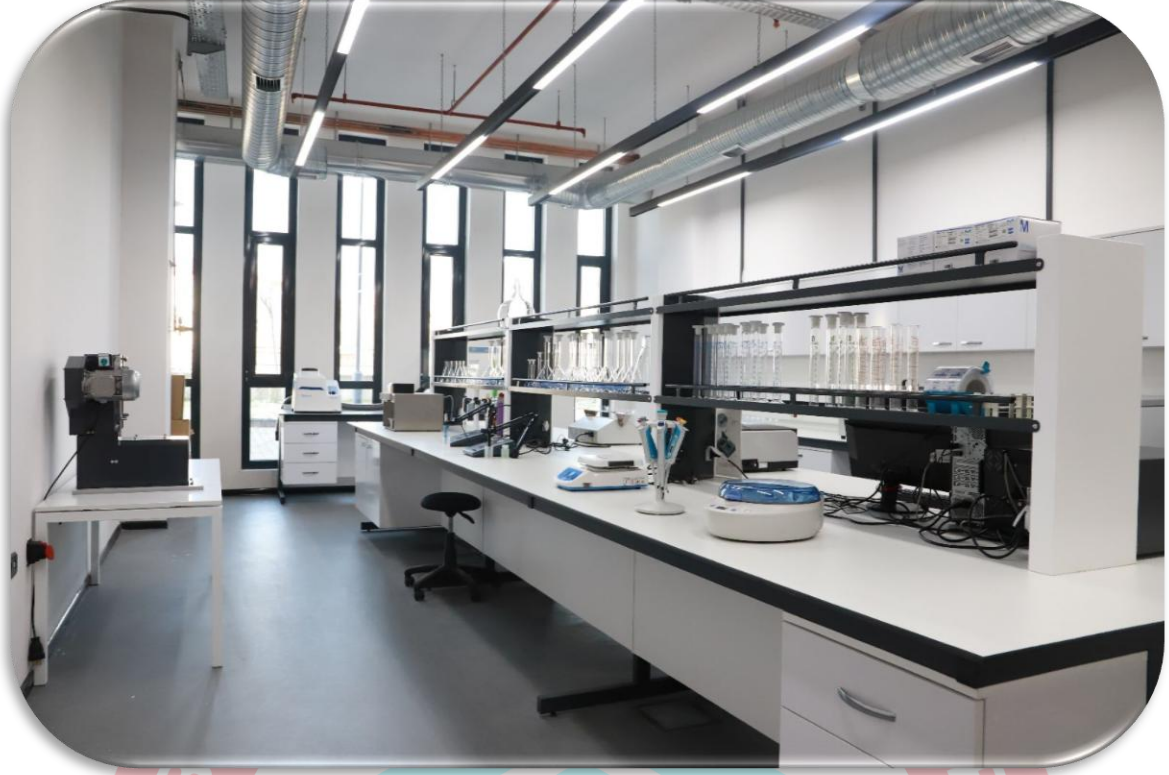
Şekil 5. Toprak Bilimi ve Bitki Besleme Laboratuvarı

4.1.1.6. Kalite Laboratuvarı: Artan dünya nüfusuna paralel olarak gıdaya olan talep de her geçen gün artarak devam etmektedir. Dünya Gıda ve Tarım Örgütü'nün (FAO) tahminlerine göre 2050 yılı olası dünya nüfusunun gıda ihtiyacının karşılanabilmesi için tarımsal üretimin yaklaşık %70 oranında artırılması gerekmektedir. Günümüzde üretimin artırılmasının yanı sıra kaliteli gıdanın da artırılması gerekmektedir. Örneğin, gıdalarda mikro besin eksikliği, “gizli açlık” olarak da bilinmekte ve “kalori bakımından yeterli olmasına rağmen mental ve fiziksel gelişme için yeterli olan vitamin ve/veya mineraller bakımından yetersiz beslenme” olarak tanımlanmaktadır. Mikro besin bakımından yetersiz beslenme de küresel bir sağlık sorunu olup, gelişmekte olan ülkelerde iki milyardan fazla insanı ve dünya çapında ise üç milyardan fazla insanı etkilemektedir. Bu nedenlerden kaynaklı bitkisel ürünlerde yürütülen ıslah çalışmalarında amaç, üretici için verimi yüksek, hastalık ve zararlılara dayanıklı, sanayici için son ürüne ve tüketici için ise tüketim isteğine uygun kalitede çeşit geliştirmektir. Bu kapsamda Sivas Bilim ve Teknoloji Üniversitesi Tarım Bilimleri ve Teknoloji Fakültesi bünyesinde yer alan kalite laboratuvarında, başta hububat ve baklagiller olmak üzere kaliteli çeşitlerin geliştirilmesine katkı sağlanmasının yanı sıra birçok bitkide ve bu bitkilerden elde edilen son ürünlerde kalitenin belirlenmesine yönelik çalışmalar yürütülmektedir.