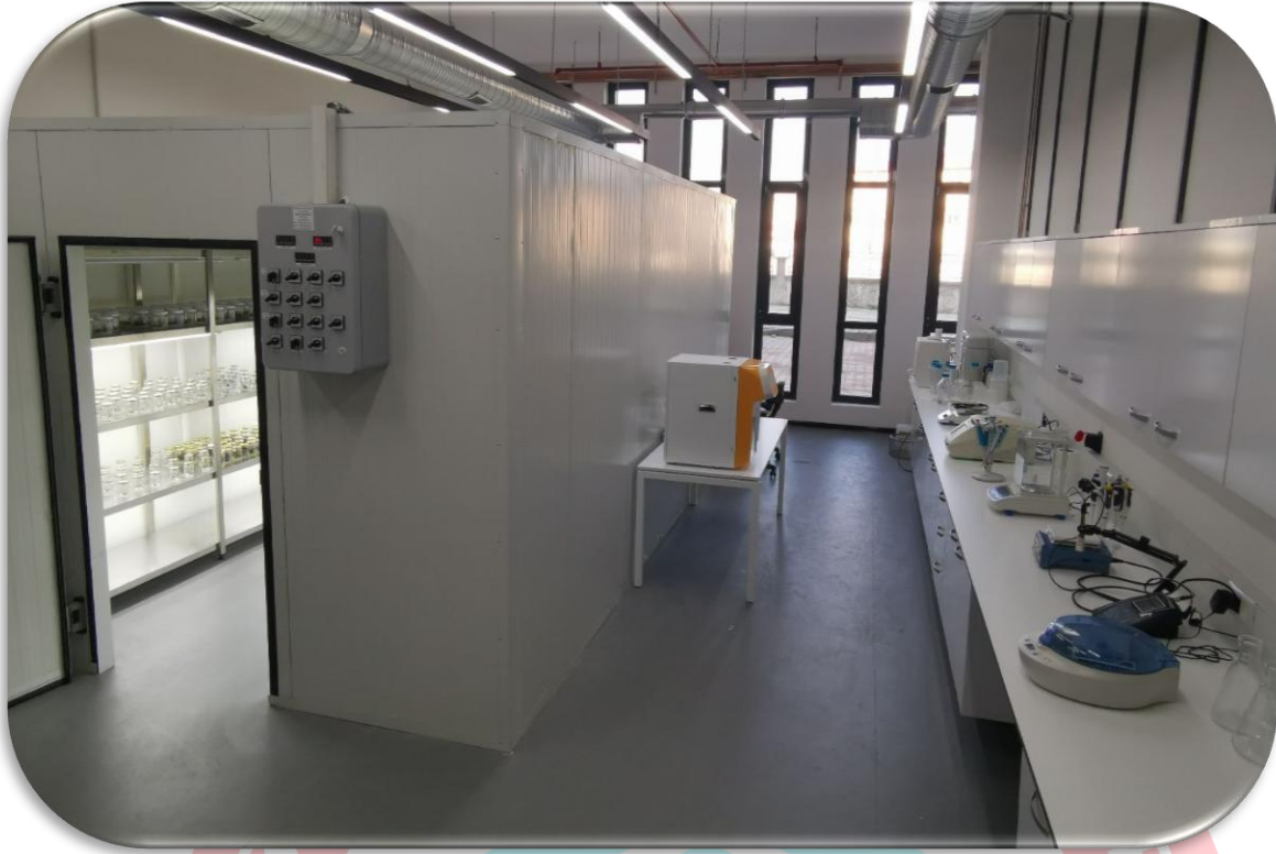
Şekil 2. Bitki Doku Kültürü Laboratuvarı

4.1.1.3. Bitki Zararlıları Laboratuvarı: Laboratuvarımızda, bitki ve bitkisel ürünlerde görülen zararlıların (böcek, akar, nematod, kemirgen vb.) teşhisinin yapılarak bu zararlıların yayılışlarının, yoğunluk ve zarar seviyeleri ile faydalıların tespit edilmesi önemli zararlıların biyo-ekolojileri, epidemiyolojileri ve neden oldukları ürün kayıplarını incelenerek olası mücadele yöntemlerini ortaya konmasına yönelik çalışmalar devam yürütülmektedir. Mücadeleye yönelik olarak özellikle Avrupa Birliğinin “Green Deal the Biodiversity and Farm to Fork” stratejisi kapsamında kimyasal pestisitlere alternatif bitkisel orjinli pestisitlerin ve biyolojik mücadele etmenlerinin tespiti ve kullanımına yönelik çalışmaların yanı sıra ıslah materyallerinin nematodlara dayanıklılık durumlarının belirlenmesine yönelik çalışmalar ele alınmaktadır.