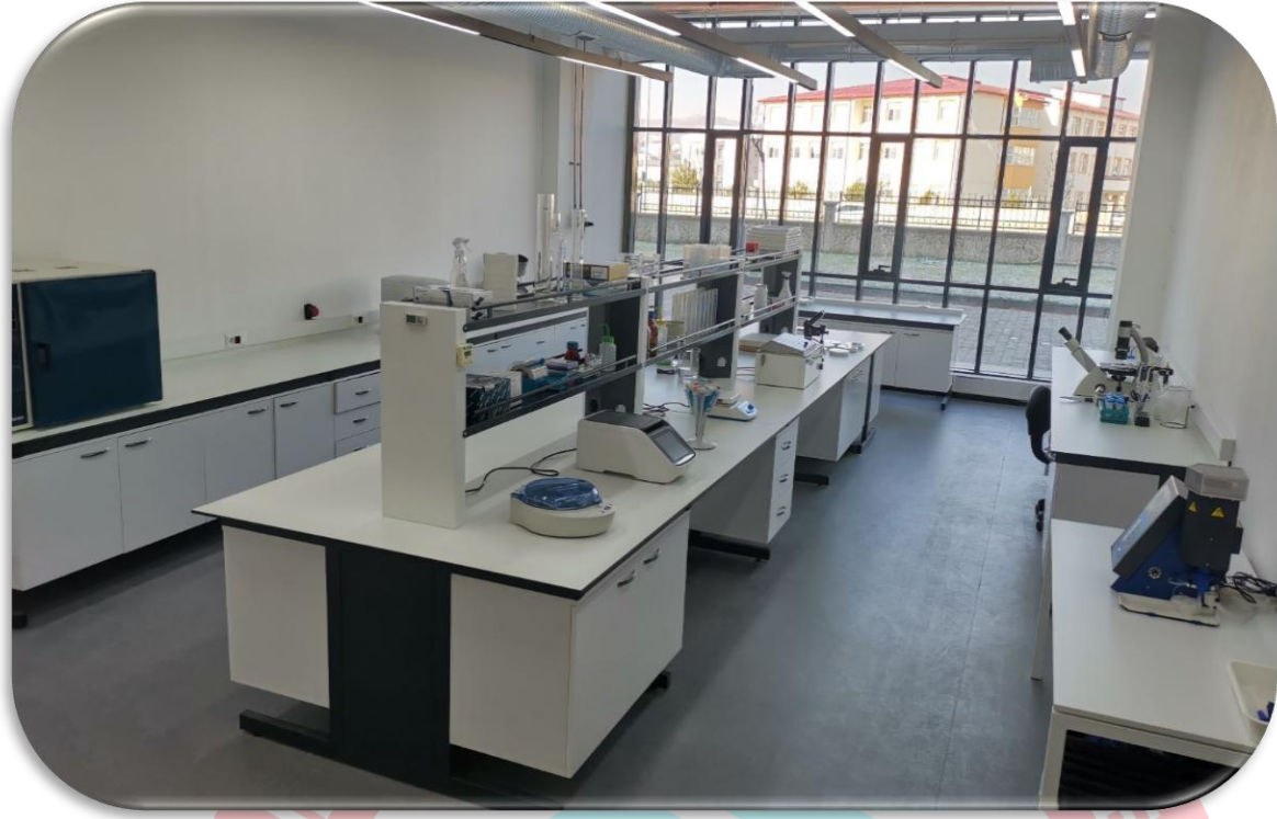
Şekil 3. Bitki Zararlıları Laboratuvarı

4.1.1.4. Bitki Hastalıkları Laboratuvarı: Laboratuvarımızda, bitkilerde hastalıklara neden olan fungal, bakteriyel ve viral etmenlerin tespiti ve tanısını yapmak, bu etmenlerin yayılışını ve mücadele yöntemlerini belirlemek, kimyasal ilaç kullanımının önüne geçmeye yönelik olarak söz konusu hastalıklar ile mücadele çalışmaları ve ıslah materyallerinin hastalıklara olan dayanıklılığını belirlemeye yönelik çalışmalar yürütülmektedir.