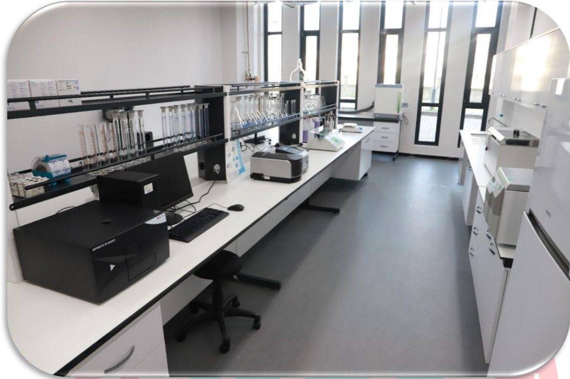
Şekil 6. Kalite Laboratuvarı

personelin bilimsel çalışmalarının gerçekleştirilmesi, yüksek lisans ve doktora öğrencilerinin tez çalışmalarını yürütülmesi gibi konularda faaliyetlerini sürdürmektedir.