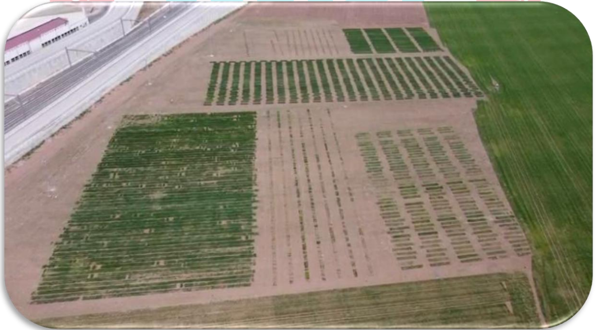
Şekil 8. Tarımsal AR-GE Merkezi