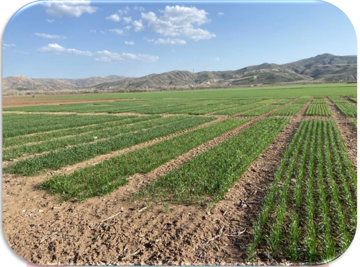
Şekil 7. Tarımsal AR-GE Merkezi