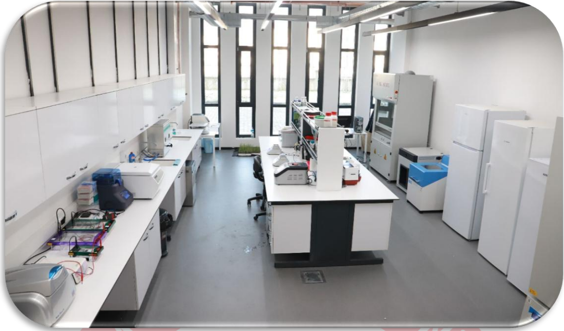
Şekil 1. Moleküler Genetik Laboratuvarı

4.1.1.2. Bitki Doku Kültürü Laboratuvarı: Üç ana bölümden oluşan laboratuvarımızın ilk bölümünde materyallerin getirilip temizlendiği, besin ortamlarının hazırlandığı, sarf malzemelerin bulunduğu ön hazırlık odası, ikinci bölümde steril kabinin bulunduğu ve bitki parçalarından steril koşullarda yeni doku veya bitki üretimlerinin yapıldığı transfer odası, üçüncü bölüm de ise bitkinin gelişimi için optimum şartların sağlandığı bitki büyütme odası yer almaktadır. Bitki Doku Kültürü laboratuvarında yılın her döneminde iklim koşullarına bağlı kalmadan üretim yapılmaktadır. Bu kapsamda hastalıktan ve virüsten arı bitki üretilmesi, Türkiye’de yetişen farklı türlerin sürgün ucu kültürü ile çoğaltılması, bitki ıslah süresinin kısaltılması amacıyla haploidizasyon tekniklerinin kullanılması, abiyotik ve biyotik stres koşullarına dayanıklı bitki elde etme çalışmaları yürütülmektedir. Laboratuvarımız; Avrupa Birliği, TÜBİTAK, TAGEM, BAP gibi uluslararası ve ulusal düzeyde desteklenen projelerin yürütülmesi, lisans öğrencilerinin uygulama derslerinin yapılması, akademik personelin bilimsel çalışmalarının gerçekleştirilmesi, yüksek lisans ve doktora öğrencilerinin tez çalışmalarını yürütülmesi gibi konularda faaliyetlerini sürdürmektedir.